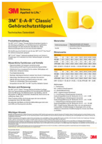
3M E-A-R Classic Earplugs Technical Datasheet German