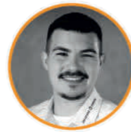
Manuele Falcone Spedition, Logistik